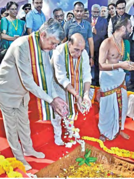
శుక్రవారం పుట్టపర్తిలో ఆధునిక యుద్ధ విమాన ప్రాజెక్టుకు శంకుస్థాపన చేస్తున్న రక్షణమంత్రి రాజ్ నాథ్ సింగ్, సీఎం చంద్రబాబు

23 నెలల్లో 23లక్షల కోట్ల పెట్టుబడులు తెచ్చాం.. సీమను డ్రాట్ ఖోన్ నుంచి గ్రోత్ ఖోన్ గా మారుస్తున్నాం ఆత్మనిర్ధర్ భారతీలో ఎపి ముఖ్యపాత్ర యుద్ధ విమాన ప్రాజెక్టు శంకుస్థాపనలో సీఎం చంద్రబాబు